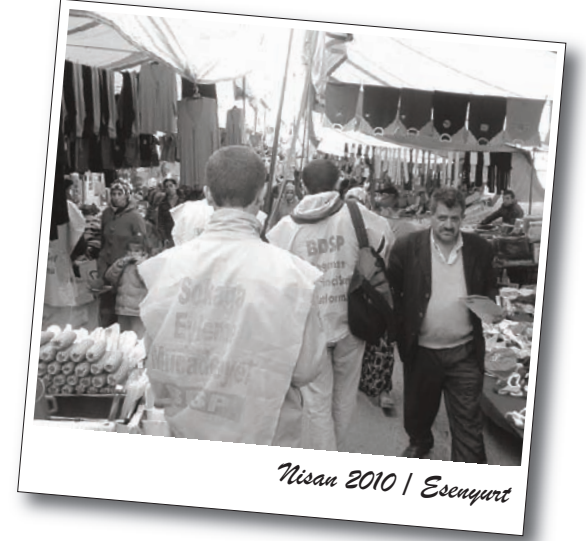
Nisan 2010 | Esenyurt

Alsancak Garı önünde toplanan BDSP'liler, TARİŞ Bölge Müdürlüğü önüne doğru yürüyüş gerçekleştirdi. BDSP'liler, direniş alanına girildiğinde TARİŞ işçileri tarafından alkışlar ve "Asla yalnız yürümeceksin!"