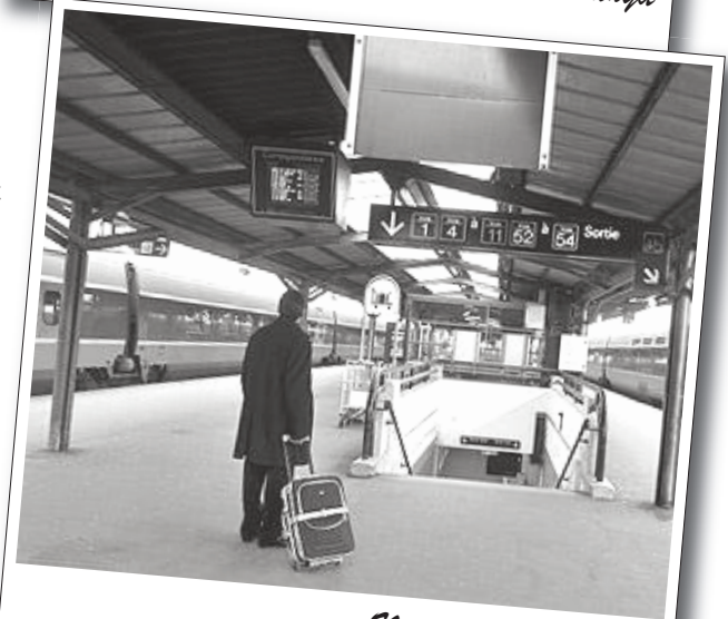
Nisan 2010 | Fransa

İşiler, hükümetin PSEB'yi özelleştirmek istemesine karşı direniyorlar. Bunun dışında ücret artışı talep eden elektrik işileri çalışırken yaşamını yitiren işinin yerine onun bir yakınının işe alınmasının garanti altına alınmasını istiyorlar.