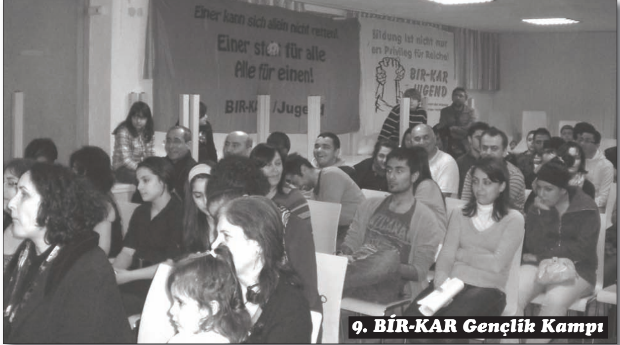
9. BİR-KAR Gençlik Kampı

Öte yandan gelinen bölgeler veya cins temelinde gruplaşmaların önüne tam olarak geçebildiğimizi söyleyemeyiz. Bu sorun yaş farklılığı gibi daha doğal bir sebebi olsa da esas olarak kampımızı henüz tam olarak gençlik çalışmasına dayandıramama gibi daha temelli bir sebebe dayanmaktadır. Böyle olduğu ölçüde kampa geli sebepleri bile farklılaşmakta, bu ise gerçek bir kaynaşmayı engelleyen bir faktöre dönüşebilmektedir. Kaynaşma sorununun, örgütlülüğümüzün olduğu bölgelerden gelen gençlerde