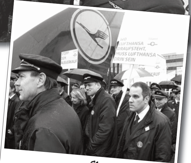
Nisan 2010 | Almanya

Hindistan'ın Punjab eyaletinde devlete ait PSEB elektrik işletmelerinde çalışan 60 bin işi greve çıktı.